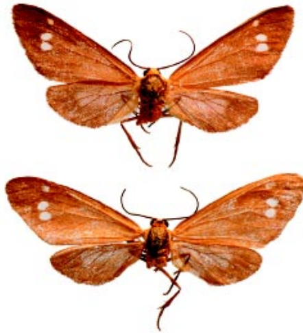
Fig. 2 Exemples de Dysauxes ancilla (Linnaeus, 1767), capturats a Puig Ventós, Vidreres (Girona), els dies 14 i 21 de juny de 1982 (M. Ahola & L. Kohonen leg.).