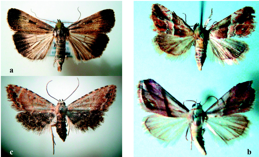
Fig. 2 Adults de: a , Lygephila exsiccata (Lederer, 1885), Bassa dels Ous (la Tancada, Amposta), ♂, 13.VIII.2004; b , Eublemma cochylioides (Guenée, 1852), llacuna de l'Encanyssada (Amposta), 13.VIII.2004; c , Araeopteron ecpahea (Hampson, 1914), Amposta (delta de l'Ebre).