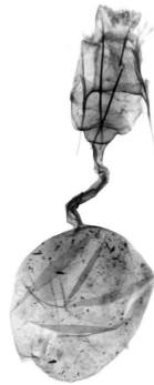
Fig. 2 Ginopigi de Pasiphila debiliata .

Material estudiat. Sant Bartomeu del Grau (Osona) (31TDG25, 830 m), 1♂, 10.VI.2000 i 1♀, 2.VI.2002 (J. Ylla leg.); Vespella de la Plana (Osona) (31TDG34, 650 m), 1♂, 8.VI.1996; 1♀, 14.VI.1996 i 1♀, 21.VI.1999 (J. Ylla leg.); Montesquiú (Osona) (31TDG36, 590 m), 1♂, 19.V.1991 (J. Ylla leg.).