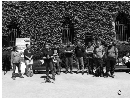
Fig. 1 Algunes imatges testimonials de la participació de la SCL en la quarta BioBlitz BCN: a , el Laberint d'Horta, peça central del jardí, amb l'estàtua d'Eros al mig; b , instal·lació del punt de llum, sota l'atenta supervisió d'Ariadna des del temple que li està dedicat; c , el punt de llum instal·lat al peu de l'escala neoclàssica, on una parella de nuvis es deixa fotografiar; d , trampa de llum col·locada a prop de la bassa que hi ha darrere del pavelló neoclàssic; e , acte de cloenda, amb els especialistes dels diferents grups explicant els resultats obtinguts.